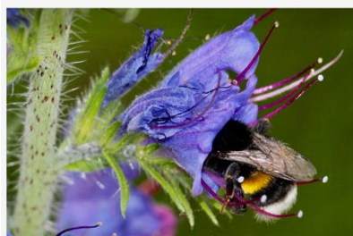
Die Blüte des Natternkopfs lockt Hummeln mit ihrem Nektar

Viele Vögel bauen sich ein Nest oder suchen sich eine Stelle zum nisten. Auch die Insektenwelt ist fleißig unterwegs! Vielleicht habt ihr auch schon die ersten Bienen und Hummeln gesehen!